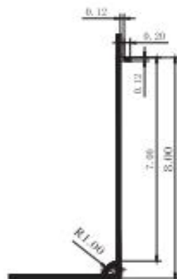
8人制足球场地角球区平面示意图(局部)